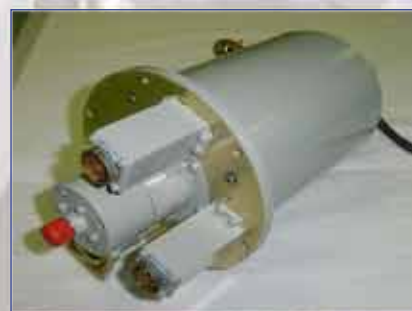
Устройство Roll-Ring® в разрезе